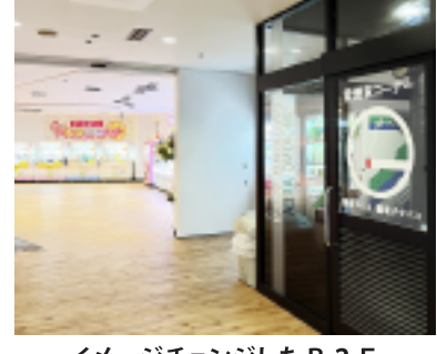
イメージチェンジしたB2F

B2Fの核店舗交替に合わせ、愛煙家コーナーやゲームコーナーを新設し、床・壁・天井も明るく