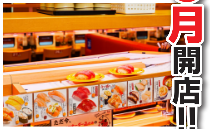
スシロー店内(イメージ)