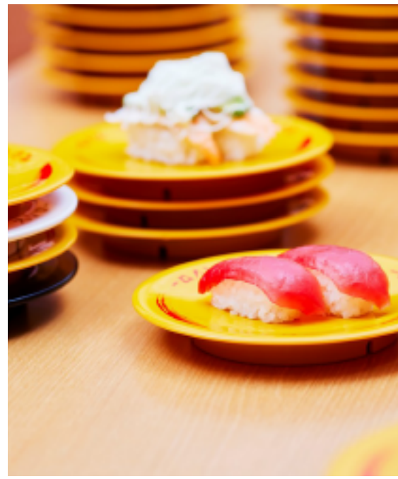
スシローこだわりのおすし (※写真はイメージです)