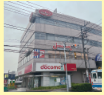
不動産譲渡契約時の記念写真

4Fトランスコスモス殿がご入居を始業させました。当社は経営理念に従い、テナント各位と協働して世の中のお役立ち