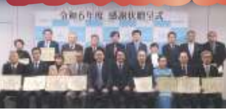
一緒に感謝状を拝受した皆様