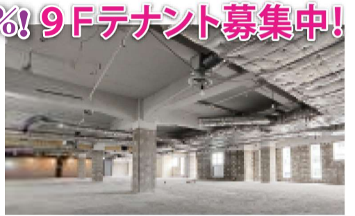
スケルトン化が完了した9Fの現状

8Fデベロッパ殿が営業を再開され、残すは11Fと9Fの医院跡区画ですが、11Fは7月、歯科医院が開業準備中です。9Fは3月末末原状回復除染が完了し、リリーシング活動に入りました。募集要項は不動産流通システム(レイズ)に登録済みです。