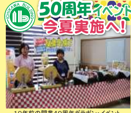
10年前の開業40周年ガラポンイベント

当社が事務局(兼)エンジン役を務め、街を元気にする活動を四半世紀継続中の、産官学民連携の元氣!市川会は、今春から活動再開中です。3月から例会を再開し、4月からは駅前イベントステージも開始しました。当会は安全で活気溢れる街づくり活動を行行政・警察・大学・