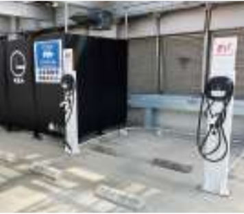
5F新設のEVプラグイン充電装置

TCMアイビス ターミナルシティ本八幡商業棟アイビス5Fの愛煙家コーナー隣に、電気自動車EVの充電装置が新設稼働中です。開業10年を迎える当ビルは、看板照明、ポンプ類等保守を要する設備に対しては、迅速に対応する一方で、2・3Fヤマダデンキ殿の販促支援に加えて、1Fカスミ殿・B1F医療モール殿の営業も積