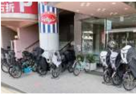
自転車放置で占拠された市川ビル5の玄関